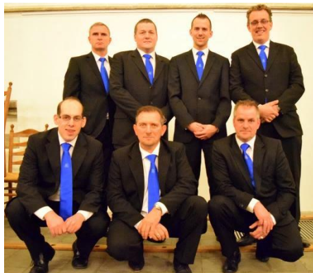
Bestuur Omnis Cantare